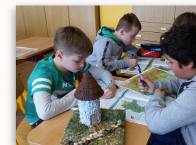
"Putujeme po štvrtácky" alebo netradičná Vlastiveda