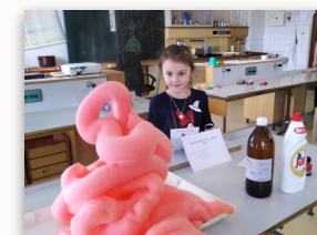
Pokusy a objavy počas "Predškoláckeho expresu"