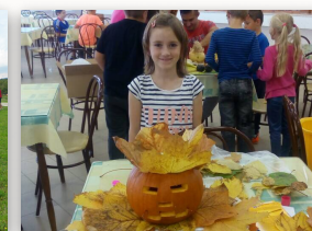
Tekvičkovanie - aktivita ŠKD