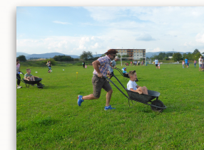
Deň školy a rodiny